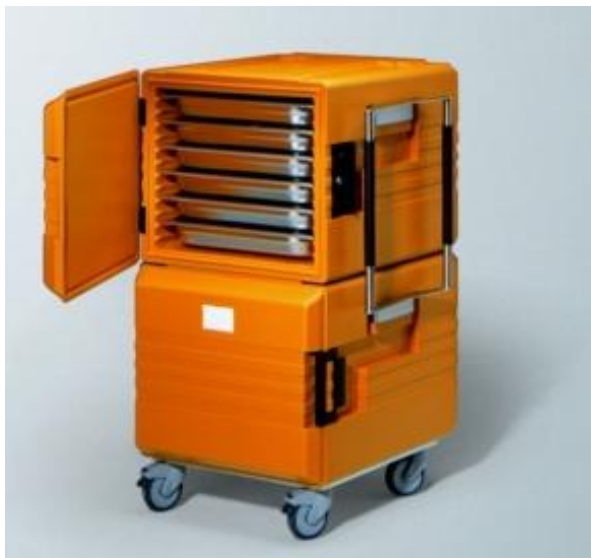
Version 2 x 6000 K (non chauffant) mobile

Le système Thermoport® Rieber pour la conservation, le transport et la distribution des plats, offre une multitude d'avantages qui s'harmonisent à la perfection.