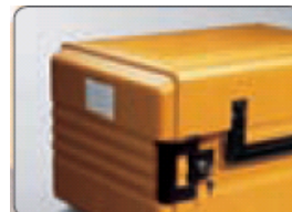
Lavable au lave-vaisselle