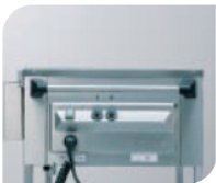
Tableau de commande ergonomique