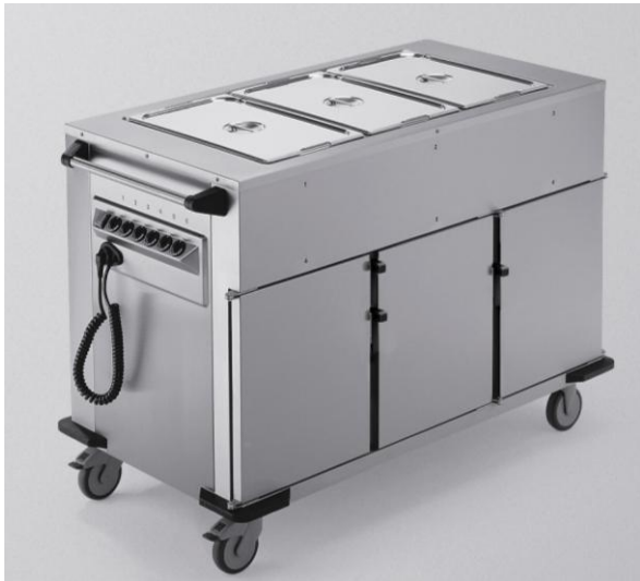
Modèle Norm-III-3, référence 88 13 14 21