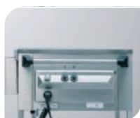
Tableau de commande ergonomique