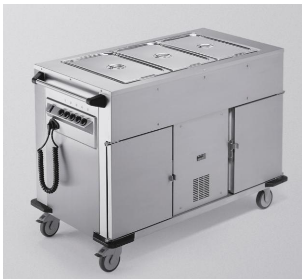
Modèle Norm-III-1-1K, référence 88 13 18 21